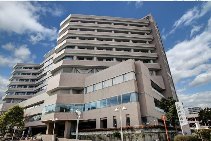
地方独立行政法人 市立大津市民病院