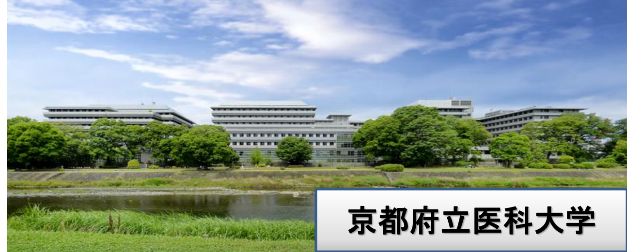
京都府立医科大学