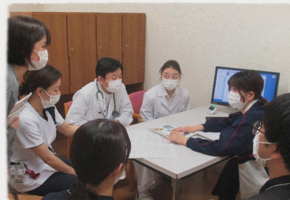
退院カンファまで