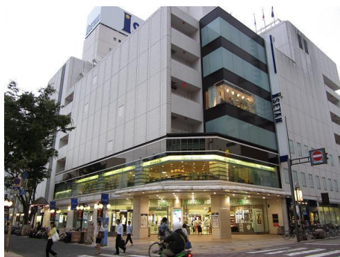
伊勢丹まで徒歩3分