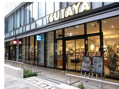
病院裏手に大型書店・カフェ