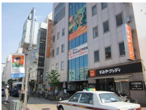
契約スポーツジムは徒歩1分