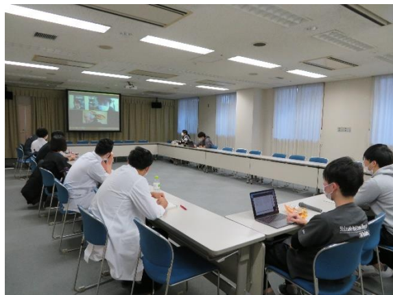
感染症カンファレンス