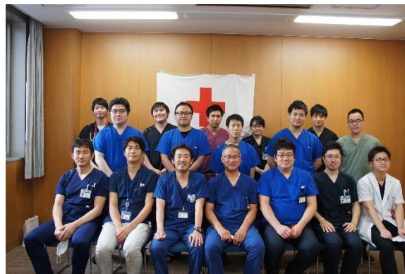
外科・消化器内科