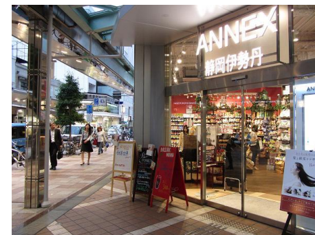
駅まで続く活気ある呉服町名店街

静岡駅より徒歩10分。静岡市の中心地にあり、周りに商店街・デパート・大型書店・映画館・スポーツジムなどがあり、活気にあふれています。