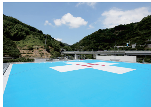
屋上に設置したヘリポートは、平成29年2月以来、月平均1~2回の頻度でドクターヘリによる転院搬送で使用しています。今後も活用が期待されます。

市立八幡浜総合病院での2年間の研修を終えて、とても充実した毎日を過ごすことができました。一般内科・循環器内科の先生方のご指導のもと、内科一般領域を幅広く経験することができ、また、専門としたい糖尿病・内分泌代謝の領域では専門の先生のご指導のもと、学会発表やカンファレンスでの症例検討を通し、深く学ぶことができました。メディカルスタッフ、事務の皆様も研修に非常に協力的で、多くを学びながら楽しく研修を終えることができました。