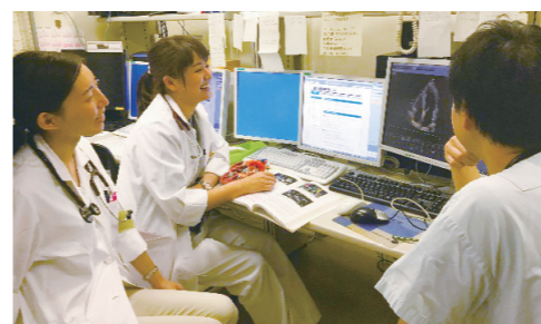
心臓超音波波カンファレンス風景

今治は大型のショッピングセンターが出来たり、美味しいお店が増えたり、とても住みやすい街でもあります。衣食住も大切ですよね!