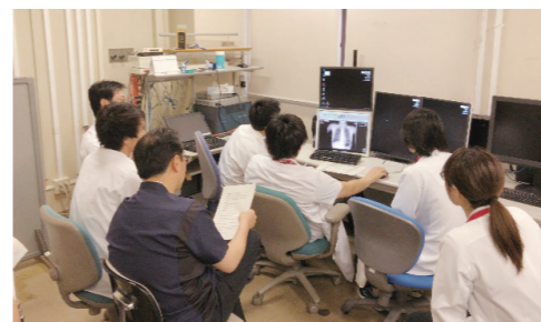
救急明けカンファレンス風景